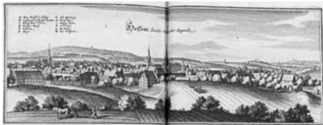
Hessen in einem Merian-Stich um 1650